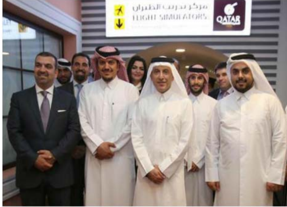
الباكر أمام مركز تدريب الطيران

وسيقوم الصفار أيضاً بدور موظفين تسجيل الدخول في مطار حمد الدولي وإصدار بطاقات صعود الطائرة إلى المسافرين من مكاتب تسجيل الدخول المماثلة لتلك الموجودة في المطار. ولدى وصول الأطفال إلى كيدز موندو الدوحة، تبدأ رحلاتهم بمكاتب تسجيل الدخول، حيث يدخلون المدينة ليصبحوا جزءاً من تجربة رائعة ومواطنين لهذه المدينة.