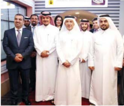
• لحظة جماعية للمسؤولين في الشركة وإيل