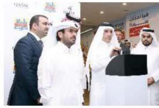
تعريف الأطفال كيفية الإقاع بالطارات

وفي حال رغب الصغار أنفسهم بالقيام في السماء، والتضمام إلى طاقم الصياغة للخطوط الجوية القطرية، فيمكنهم كتابة أوامر أكثر من سلامة، وراحة المسافرين على متن الطائرة، ويستطيع الأهل المشاركة أيضاً بصفتهم كأفراد، وتم تصميم الطائرات الجديدة لتحاكي الحظائف الرائعة، وقت الإقاع والهبوط في مطار حمد الدولي، بوابة النافذة إلى العالم، وستوفر مدينة الألعاب المفعلة