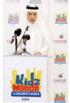
• الباكسر خلال كمنته

حيث تجمع هذه التجربة بين الترفيه والتعليم، وفي أن يقوموا بدور أقرانهم الكبار على أرض الواقع، سيبسّن للأطفال التعرف على المهام اليومية للموظفين، مثل تسجيل الدخول في المطار، وبرنامج الأطفال لإتخاذ في العديد من الفرض واستكشافها في بيئة آمنة ومليئة بالمتعة تم تصميمها لتحاكي العالم الحقيقي واعتماد عليها الخاصة بها ودسورها والأصدا وبينها التحتية، وتم تعزيز هذه التجربة للتميزة بمنحها خاص تم تصميمه خصيصاً لتعليم الأطفال وتعزيز تطورهم بطريقة مرححة.