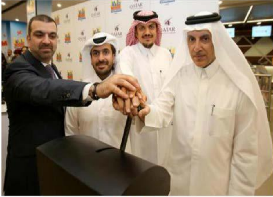
تحسين جناح القطرية في كيدز موندو

الأربعاء 10-05-2017 الساعة 07:10 م | اقتصاد