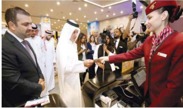
• خلال افتتاح جناح القطرية