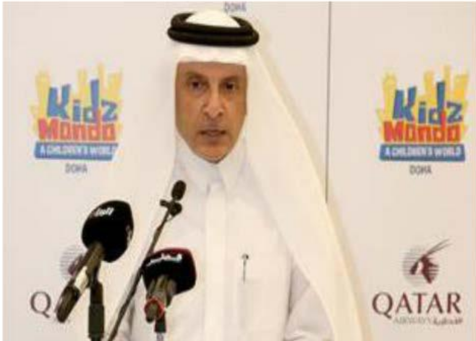
الباكر مخاطباً حفل تحشين جناحها الخاص في كيدز موندو