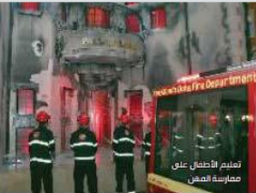
تعليم الأطفـل على مصارعة النـم

تمتد كيدز موندو الدوحة في منطقة بعلفلة على مساحة 8000 متر مربع، وتضم أنشطة متنوعة في مدينة الأطفال في قطر، وتعمل كيدز موندو حالياً في بيروت واستانبول وقطر، ويصعد خطط توسع طموحة لتعمل في مختلف دول الخليج العربي والشرق الأوسط وشمال إفريقيا، وبإدارة الشام وأسواق عالمية من ضمنها روسيا وأستراليا وأذربيجان بهدف أن تصبح المدينة التعليمية والترفيهية الأولى في العالم.