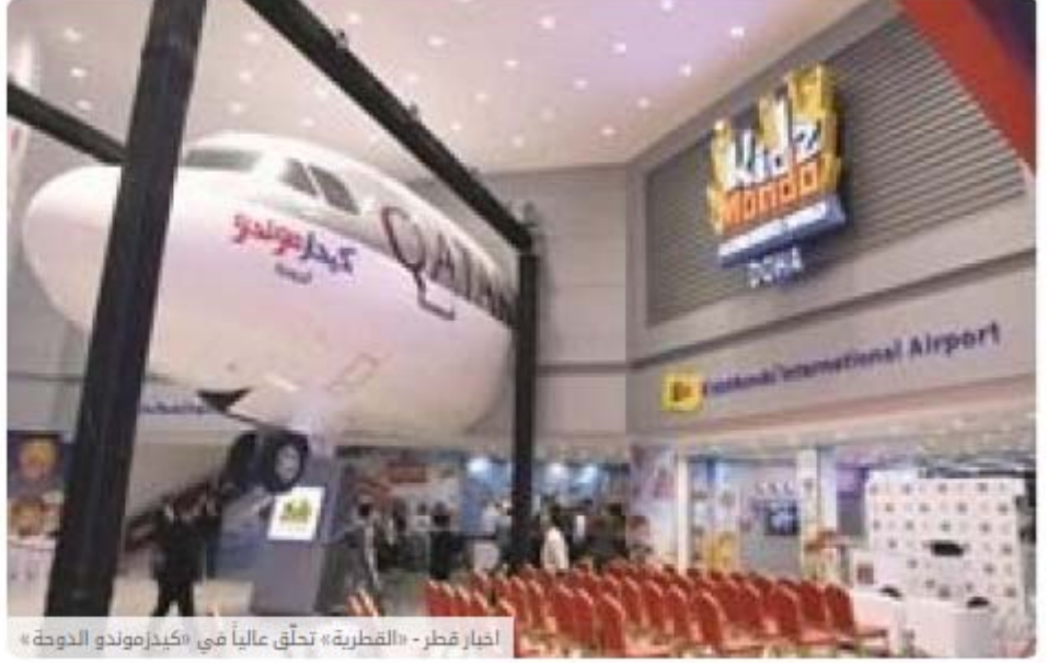
اخبار قطر - «القطرية» تحلق عالياً في «كيدز موندو الدوحة»

انت تشاهد اخبار قطر - «القطرية» تحلق عالياً في «كيدز موندو الدوحة»