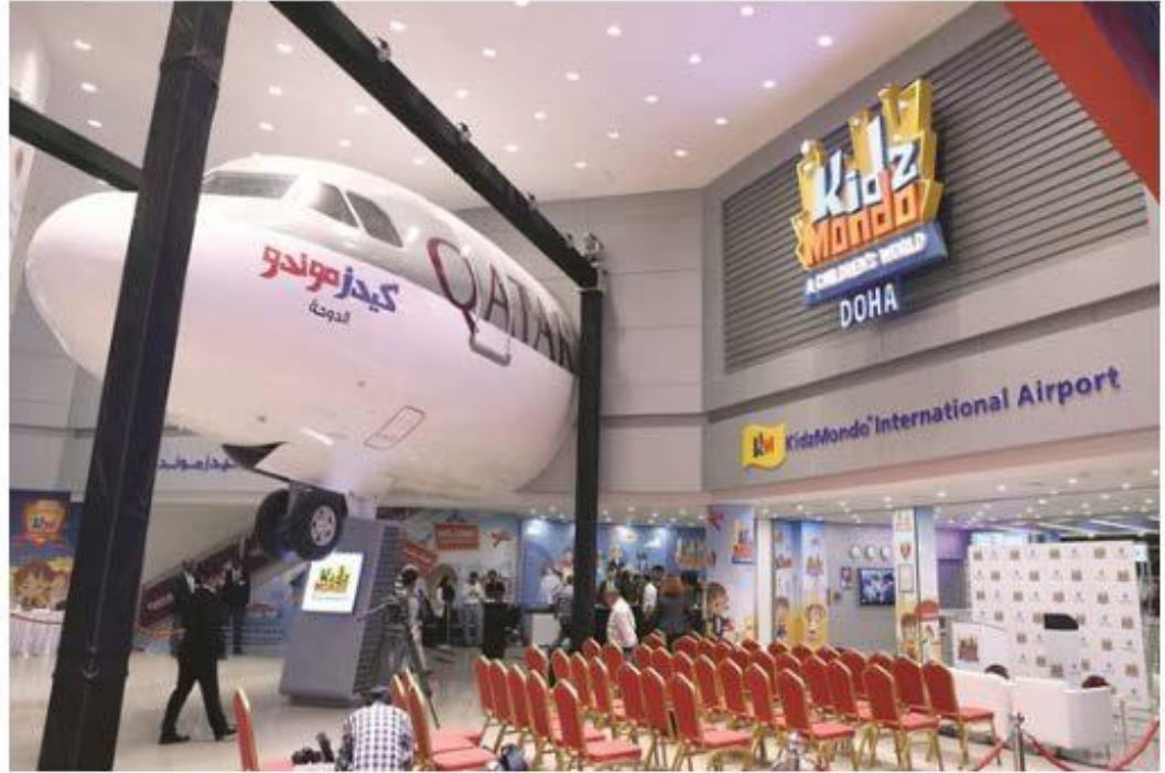
«القطرية» تحلق عالياً في «كيدز موندو الدوحة»

احتفلت الخطوط الجوية القطرية، أمس الأربعاء، بافتتاح جناحها الخاص في المدينة الترفيهية والتعليمية «كيدز موندو» في «قطر مول» خلال حفل خاص. وتقدم هذه الشراكة بين الناقل و«كيدز موندو الدوحة» مكاناً مليئاً بالمرح والتعلم للأطفال؛ حيث تمكنهم من القيام بأدوار الطيارين أو أفراد طاقم الضيافة، وتساعدهم على معرفة الوظائف المتاحة لهم في الناقل الوطنية.