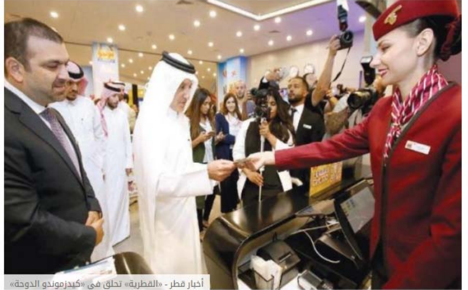
أخبار قطر - «القطرية» تحلق في «كيدز موندو الدوحة»