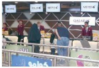
تعريف الأطفال آية المتاح مع المسافـون